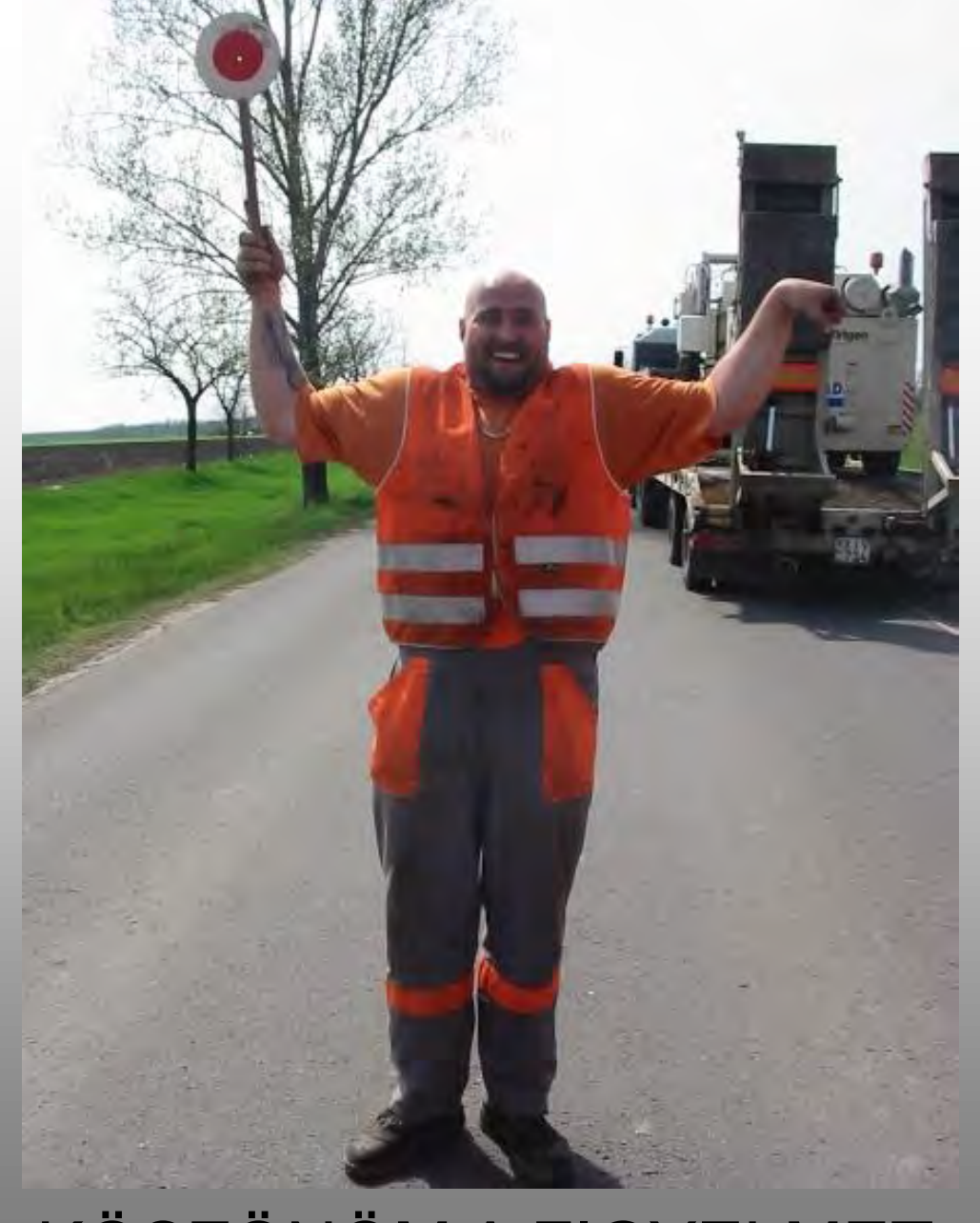
KÖSZÖNÖM A FIGYELMET